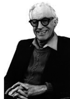
Figura 7.2. Albert Ellis es uno de los psicólogos más populares y reconocidos.

Como terapeuta cognitivo defiende que el principal determinante de las emociones y conductas de una persona son sus pensamientos y creencias, es decir, la forma en que percibe y evalúa la realidad. Y, que una parte crucial del sistema de creencias está constituida por las creencias de cada persona acerca de sí misma, es decir, por la forma de percibirse y evaluarse, que constituye el principal determinante de cómo se siente y cómo actúa con respecto a sí misma.