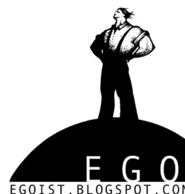
Figura 7.3. El egocentrismo es una tendencia común e insana.

Para remediar ese problema, algunos expertos como Baumeister, Kernis o Goldman han intentado diferenciar entre narcisismo y autoestima sana, con el estudio científico de una autoestima óptima que deje fuera al narcisismo (ver capítulo 6). Y, otros, como Wayment y Bauer se han centrado en conceptualizar y estudiar el llamado ego tranquilo (quiet ego), un marco conceptual que pretende comprender e investigar los problemas del egocentrismo, que consideran típico de la sociedad occidental actual.