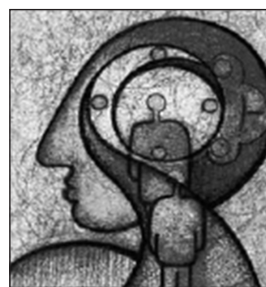
Figura 6.5. La autoestima sana supone la congruencia entre las diferentes representaciones del yo.

La sintonía entre las diferentes representaciones del yo se facilita con la autoaceptación y la posición de preferencia, que se explican en el siguiente apartado.