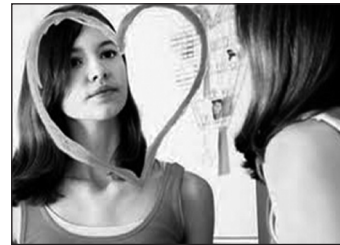
Figura 6.1. La autoestima sana es la que favorece el buen funcionamiento psicológico.