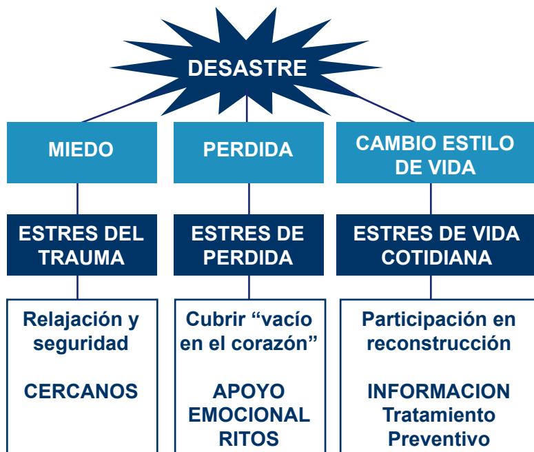
Fig. N° 5 Tipos de Estrés que generan las situaciones de Emergencias y Desastres 18

El Estrés se define como un síndrome de activación psicofisiológica que prepara al organismo para una respuesta de ataque o huida frente a una amenaza inminente.