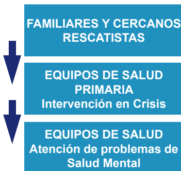
Fig. N° 4 Gradualidad del Apoyo Psicosocial 16

La ayuda psicosocial se debe entregar en forma escalonada, según las necesidades de los afectados (Fig. N°4)